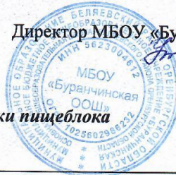
График генеральной и влажной уборки пищеблока